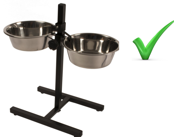
Металлическая миска на подставке